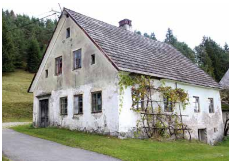
Hiša v starem vaškem jedru