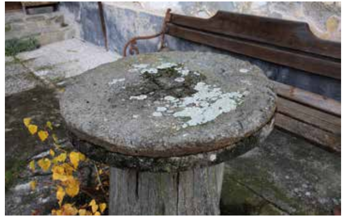
Mlinski kamen od Reparjevega mlina