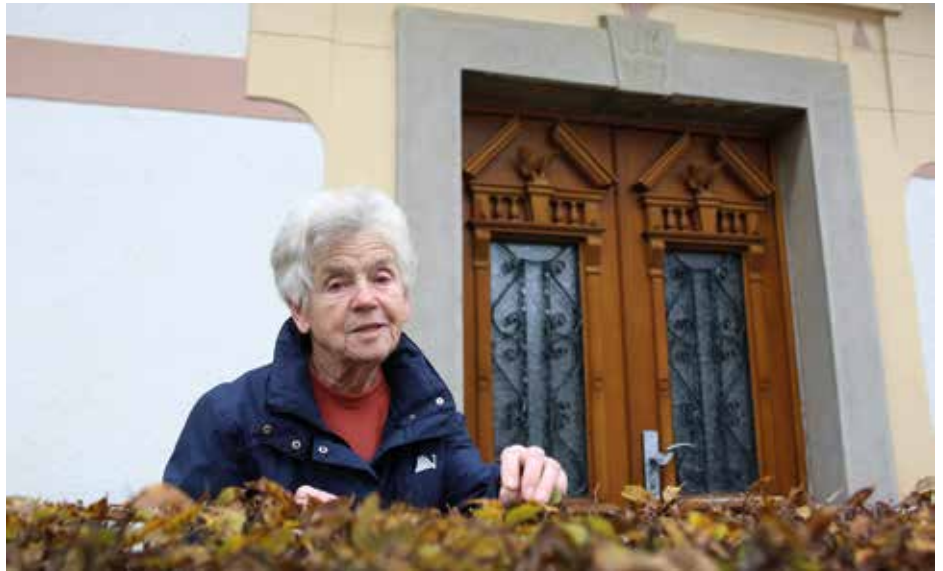
Leta 1912 je v gradnjo nove hiše zagrizla stara mama, saj je bil stari oče takrat nekaj časa Ameriki.

Zdaj je dosti boljše, saj je prav tako. Mi nismo imeli veliko, igrač prav nič. Ko smo slačili koruzo, je prišla Hrvačikova mama pomagat. Od doma je prinesla krpice in