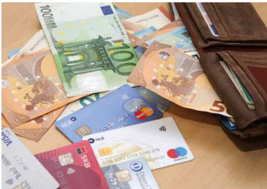
Tri četrtnine zadolževanja predstavljajo potrebe nakupa nepremičnin, četrtnina pa nakup tako imenovanih trajnejših potrošnih dobrin, avtomobilov, sodobne tehnologije.

Banke na lokalnem nivoju ne vodijo in ne obdelujejo statističnih podatkov, ki bi pokazali, kako se prebivalstvo v regiji ali občini zadolžuje in kakšno je trenutno stanje. V Sloveniji po Arharjevih besedah ne beležimo visoke zadolženosti prebivalstva, imamo zelo ugodne varčevalne navade, ki naj bi bile primerljive celo avstrijskim in nemškimi, tudi zaupanje v banke ostaja visoko. Pred krizo je imelo prebivalstvo na računih 13,7 milijarde evrov, danes pa jih ima že 19,9 milijarde. Arhar na vprašanje, ali se je morda kultura kreditnejalcev v zadnjih letih spremenila, odgovori, da temu ni tako. »Povprečna doba odplačevanja je še vedno od 20 do 30 let in oseba, ki kredit jemlje, si morda z njim zagotovi normalno življenje. So pa seveda politike bank različne, prav tako tudi deleži lastnih sredstev