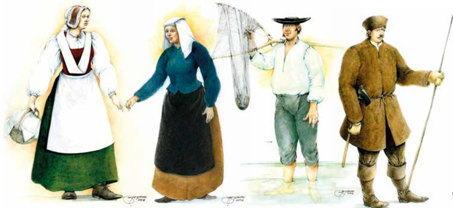
Letna in zimska ženska obleka v krajih ob Cerkniškem jezeru v 18. stoletju