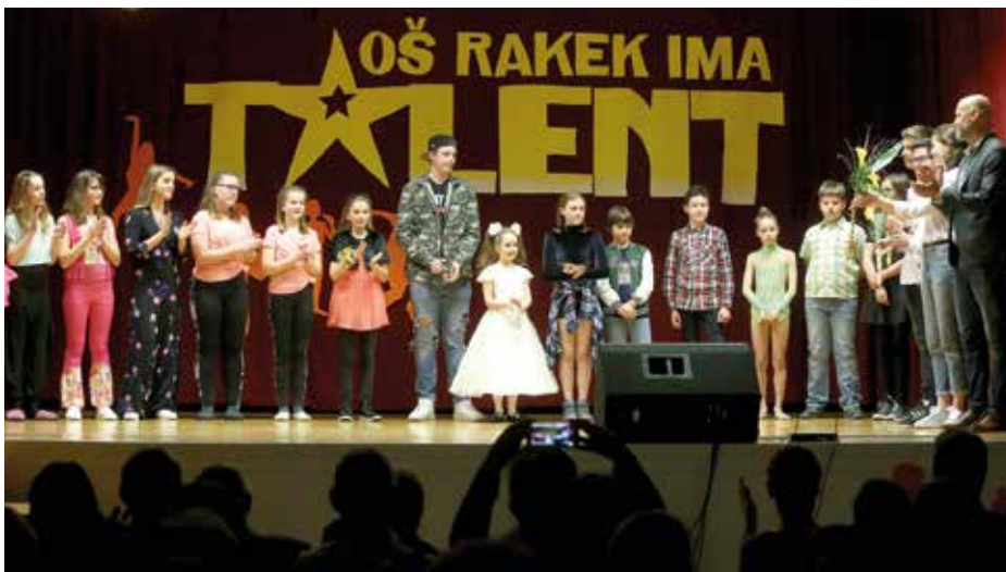
Rakovška šola krepi vrednote med učenci in zaposlenimi tudi z organizacijo različnih dobrodelnih dogodkov.

Božiček za en dan – za starejše. Pravi, da je število obdarjenih starostnikov vsako leto višje. V preteklem letu jih je bilo okoli 1000, predvideva, da bo letos to število krepko preseženo. »Kar precej prejemnikov je ravno iz Notranjske, saj je moja socialna mreža tu dobra in hitro dobim informacije,« pove. V decembru tudi pozove vse prijazne ljudi k projektu »Mala pozornost za veliko veselje«, pri katerem gre za dobre želje starostnikom po domovih in centrih za starejše. »Posamezniki pripravijo