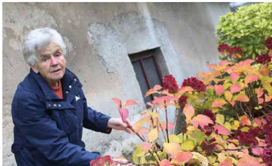
Maro Turk delo na vrtu in njivi razveseli in sprosti.

Na vrtu sem pa rada. Zjutraj poleti vstanem že ob pol petih in grem na vrt, ko je vročina, se pa uležem. Snahe so pridne in na njivi sadimo krompir, fižol, zelje, brokoli, rdečo peso ... Kumare imam pa tukaj na vrtu. To je