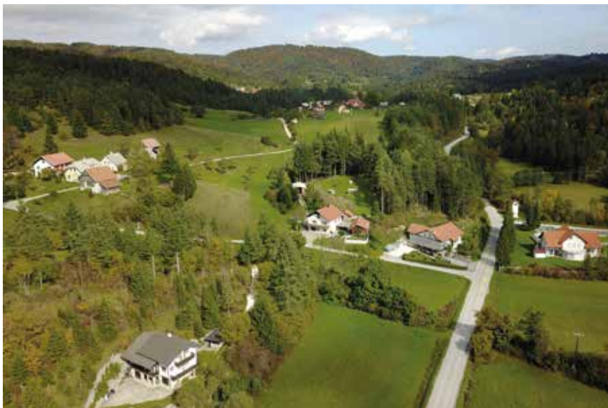
Vas ni samo na terasi, temveč tudi ob cesti.