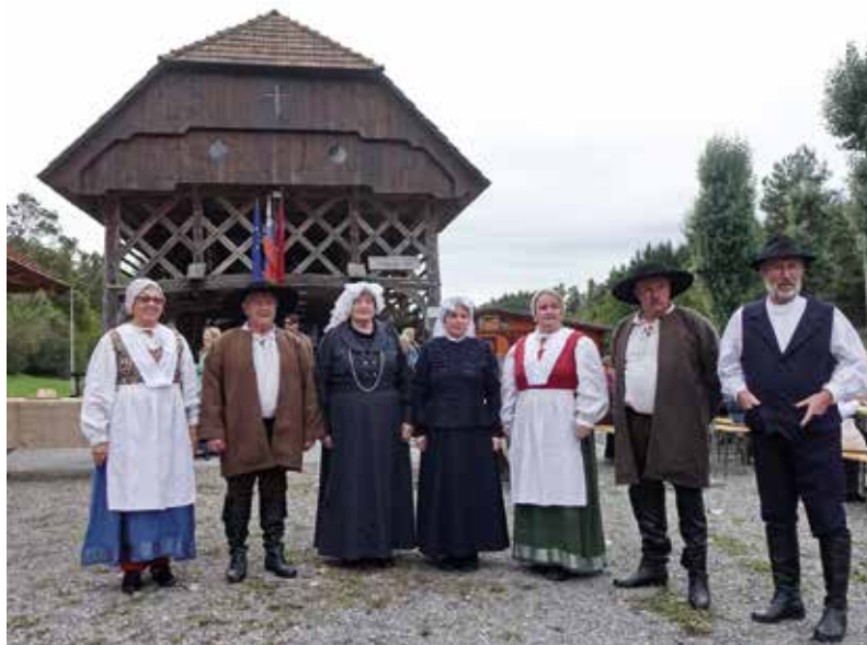
Članice in člani Društva ljudski pevci Jezerci v rekonstruiranih nošah – kostumih iz 18. stoletja in prve četrtine 20. stoletja.